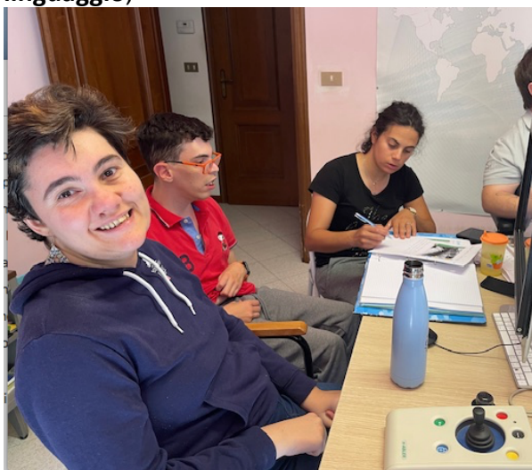
Gruppo compromissioni del linguaggio

Vedrai... è un'associazione di volontariato che si occupa di tecnologie per molteplici disabilità. L'attività principale consiste nello sperimentare le tecnologie in appositi laboratori per migliorare l'autonomia, la comunicazione e l'apprendimento. I laboratori seguono i giorni della settimana: il lunedì laboratorio per compromissioni del linguaggio;