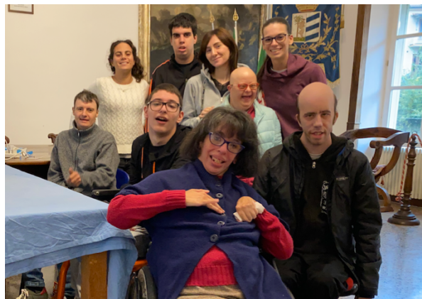
Gruppo Valle Stura

Inoltre Vedrai... ospita persone partecipanti al progetto PASS promosso dal Consorzio Servizi sociali dell'Ovadese.