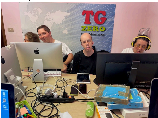
Gruppo disabilità motorie

il martedì laboratorio per paralisi e disabilità motorie;