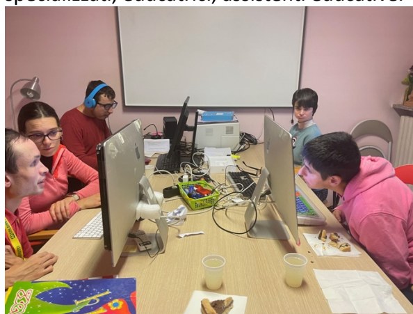
Gruppo psicosi, autismo e sindrome di Rett

Collabora con il Centro Diurno Lo Zainetto e la Comunità del dopo di noi San Domenico per far partecipare alle sperimentazioni tecnologiche persone qui ospiti. Sono una trentina i ragazzi e le ragazze che settimanalmente partecipano alle attività di Vedrai. I volontari e le volontarie che gestiscono i laboratori sono insegnanti specializzati, educatrici, assistenti educative.